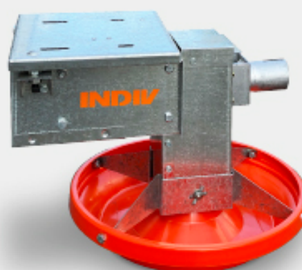
Modelo con correa